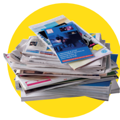
Papiers, journaux, magazines