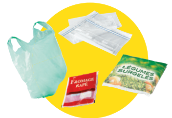
Sacs et sachets