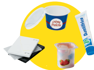
Pots et boîtes