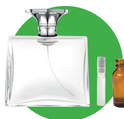
Flacons de cosmétique (parfums, huiles essentielles...)