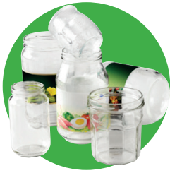
Pots, bocaux, flacons