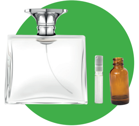
Flacons de cosmétique (parfums, huiles essentielles...)