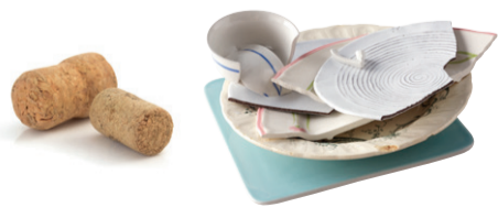
Bouchons en liège, vaisselle cassée